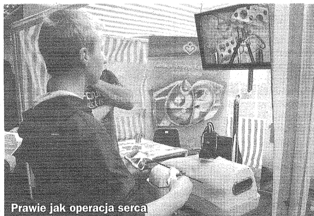
Prawie jak operacja serca

Widowiskowe doświadczenia chemiczne i fizyczne czy też najnowsze urządzenia wykorzystywane w diagnostyce i leczeniu chorób serca można było zobaczyć podczas X Dnia Nauki, który w miniony piątek odbył się w parku przy ul. Dubiela. Przygotowane przez Fundację Rozwoju Kardiochirurgii i zabrzański samorząd przedsięwzięcie przyciągnęło tłumy młodych ludzi.